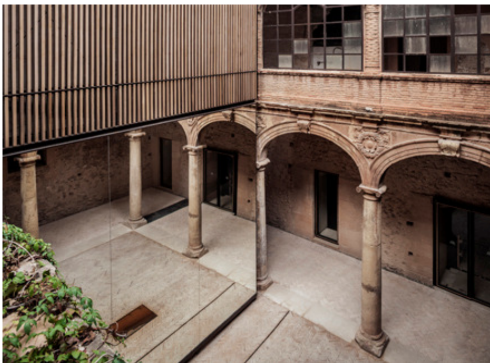
Recuperación del claustro del Palau-Castell de Betxí, del Fabricante de Esferas.

Se ha apostado por utilizar un único material como herramienta para la recuperación del claustro, consiguiendo finalizar los elementos inacabados del patio clásico y poner en valor la planta baja.