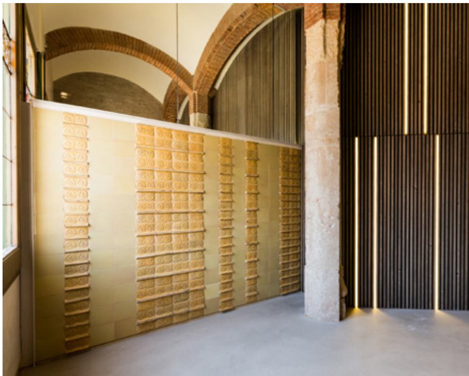
Restauración del Pabellón de Administración del recinto modernista de Sant Pau, de Joan Nogué.