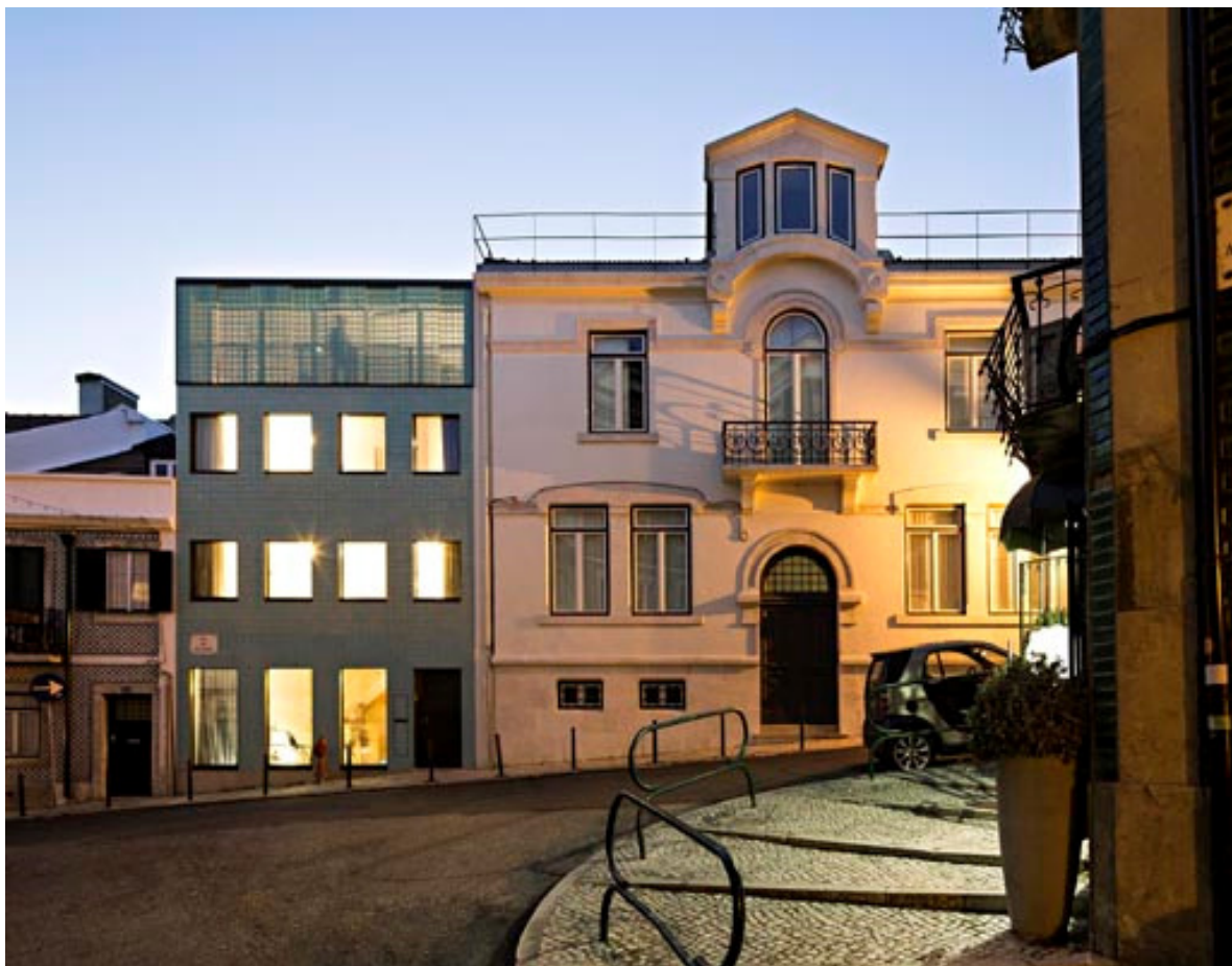
Casa en Príncipe Real de CAMARIM Arquitectos.

El revestimiento del edificio supone una aproximación contemporánea a los azulejos que cubrían el edificio anterior, el cual se encontraba en avanzado estado de decadencia. Los arquitectos definieron un conjunto de normas abstractas para transformar el motivo original de los azulejos con un modelo abstracto, personificado en tres piezas diferentes: una base de baldosa plana, una baldosa en relieve y unas piezas de acero perforado permeable a la luz.