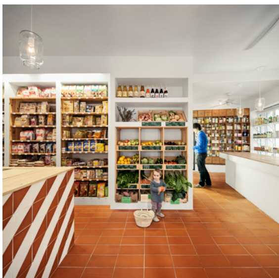
Tienda Bodebo de CAVAA.

Se apuesta por la reutilización de los elementos existentes, como la mejor garantía de que la tienda no perderá su carácter. La ‘baldosa cartabón’, presente en bancos y paredes de la tienda original, se ha utilizado de nuevo, para desarrollar las bancadas de exposición de granel y el mostrador de venta. Esta vez con pintura blanca en el esmalte y terracota vista y con un dibujo que rompe con la disposición clásica.